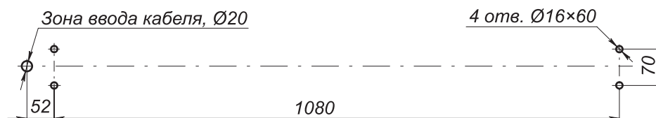
Разметка отверстий для монтажа калитки

На рисунке показана разметка отверстий для монтажа калитки. Для прокладки кабеля управления к замку в стойке рамы калитки предусмотрено отверстие.